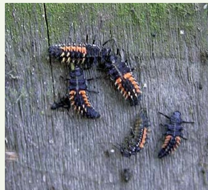
3: Larver af harlekinmariehøne. (S. Harding)

Det er ikke uden grund at harlekinmariehønen i USA kaldes Multicoloured Asian Lady Beetle, for den er meget variabel i farvetegningen. Mens de fleste af de danske arter mariehøns er nemme at artsbestemme i voksenstadiet, kan det være mere vanskeligt med harlekinmariehønen pga. den store variation. Bestemmelse af voksne harlekinmariehøns samt store larver er dog ikke umuligt, for der er en række karakteristiske kendetegn: