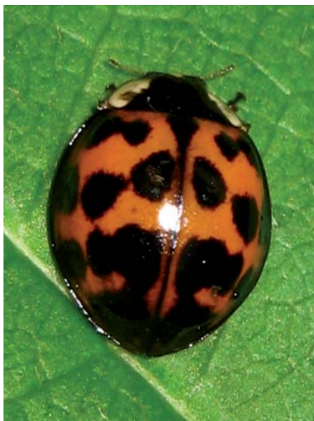
1. Harlekinmariehønen. (T. Steenberg)

Det vides ikke hvordan harlekinmariehønen er kommet til Danmark. Flere muligheder står åbne: Den kan