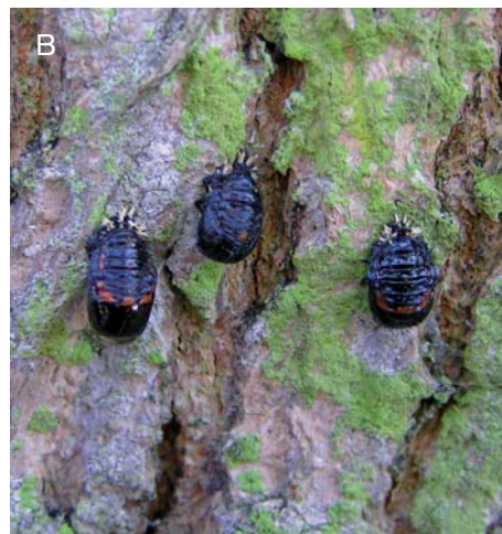
5. Pupper af harlekinmariehøne på ahorn. A: pupperne sidder tæt på stammer og grene. B: puppen fasthæftes til underlaget vha. huden fra det sidste larvestadium. København, november 2007.

invasiv. I udlandet har den koloniseret mange forskellige biotyper, har haft en negativ effekt på den biologiske diversitet og har spredt sig med stor fart.