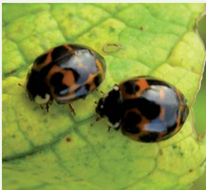
2: Mørke individer klækket i november. (S. Harding)