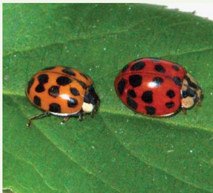
1: Typiske eksemplarer af harlekinmariehønen. (J. Christensen)