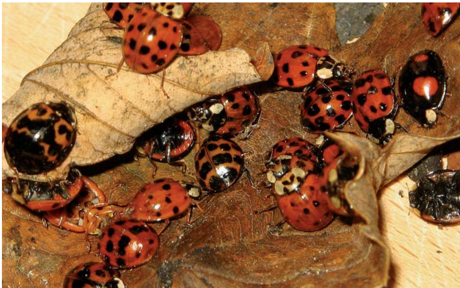
4. Stor gruppe harlekinmariehøns i et sammenrullet ahornblad. Bemærk variationen i dækvingernes farvetegning. København, november 2007. (T. Steenberg)